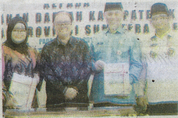
WALIKOTA bersama Wawako Padang, dan Ketua DPRD, saat menerima Opini WTP dari kepala BPK Perwakilan Sumbar, Jumat (24/5).