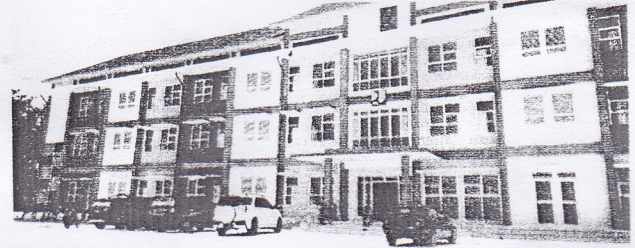
RUSUN - Rumah Susun (Rusun).

"Capaian ini tentunya salah satu bukti bahwa dukungan masyarakat dan komitmen pemerintah daerah dalam melaksanakan program kegiatan sesuai dengan penganggaran serta bertanggungjawab dalam penggunaannya dengan baik sesuai aturan yang berlaku," pungkasnya. (*)