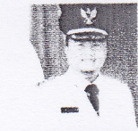
SUTAN RISKA TUANKU KERAJAAN Bupati

Bupati Dharmasraya dua periode ini menatap dan ingin menjadikan Kabupaten Dharmasraya Maju Mandiri dan Berbudaya. Hasrat untuk memajukan daerah dan masyarakat tidak pernah memudar dari pikiran bupati pilihan rakyat ini. Dalam segi pembangunan