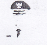
DASRIL PANIN DT LABUAN Wakil Bupati

fisik, tidak sedikit yang telah dilakukan Ketua Umum Asosiasi Pemerintah Kabupaten Seluruh Indonesia (APKASI) periode 2021-2026 ini. Bahkan pembangunan fisik yang belum tuntas sebelumnya, juga ia selesaikan. Salah satunya adalah RSUD Sungai Dareh setelah penantian 11 tahun lamanya.