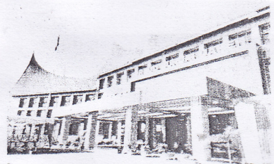
MEGAH - RSUD Sungai Dareh yang terlihat megah.