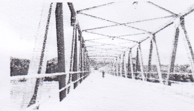
KOKOH - Jembatan Pulau yang berdiri kokoh.

DHARMASRAYA - Tidak semua kepala daerah cakap dan sukses memimpin daerah yang dinakodainya. Beda halnya dengan Rajo Kecamatan Koto Besar, Kabupaten Dharmasraya ini.