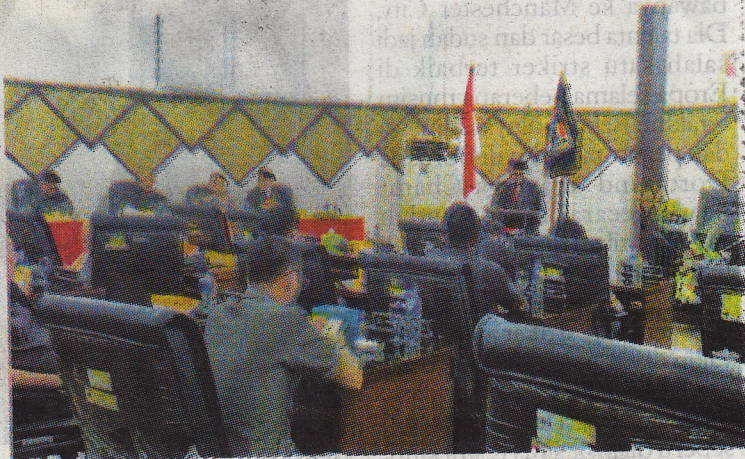
Rapat Paripurna Ranperda Pertanggungjawaban APBD 2021 di Ruang Sidang Utama Kantor DPRD Kota Padang, Senin (13/6).

“Dari PAD Kota Padang TA 2021 ditargetkan sebesar Rp808,18 miliar dengan realisasinya yaitu sebesar Rp538,93 miliar atau 75,26 persen. Untuk penerimaannya terdiri dari pajak daerah, retribusi daerah, pendapatan hasil pengelolaan kekayaan daerah yang dipisahkan serta PAD yang sah,” ucap Wako menutup. (*)