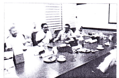
Bupati Solsel saat berdialog dengan Kepala BPK RI Perwakilan Sumbar.