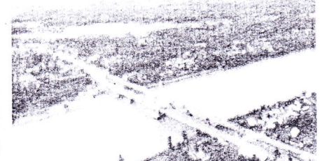
IKON - Jembatan Cabel Staved Sungai Dareh salah ikon Dharmasraya