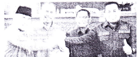
HARMONIS - Salam Komando Sekda Dharmasraya dan Pimpinan DPRD pertanda hubungan harmonis antara eksekutif dan legislatif

"Mari kita tingkatkan lagi kinerja untuk Dharmasraya Maju Mandiri dan Berbudaya," pungkasnya. (●)